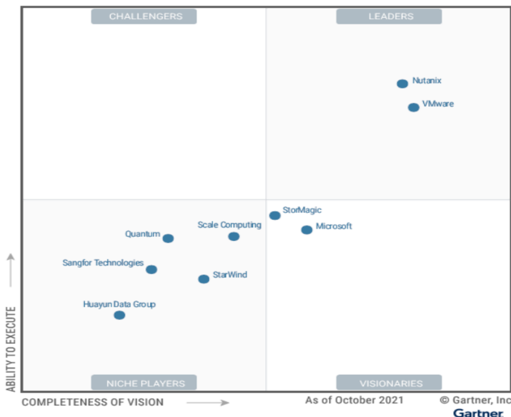
Figure 1: Magic Quadrant for Hyperconverged Infrastructure Software